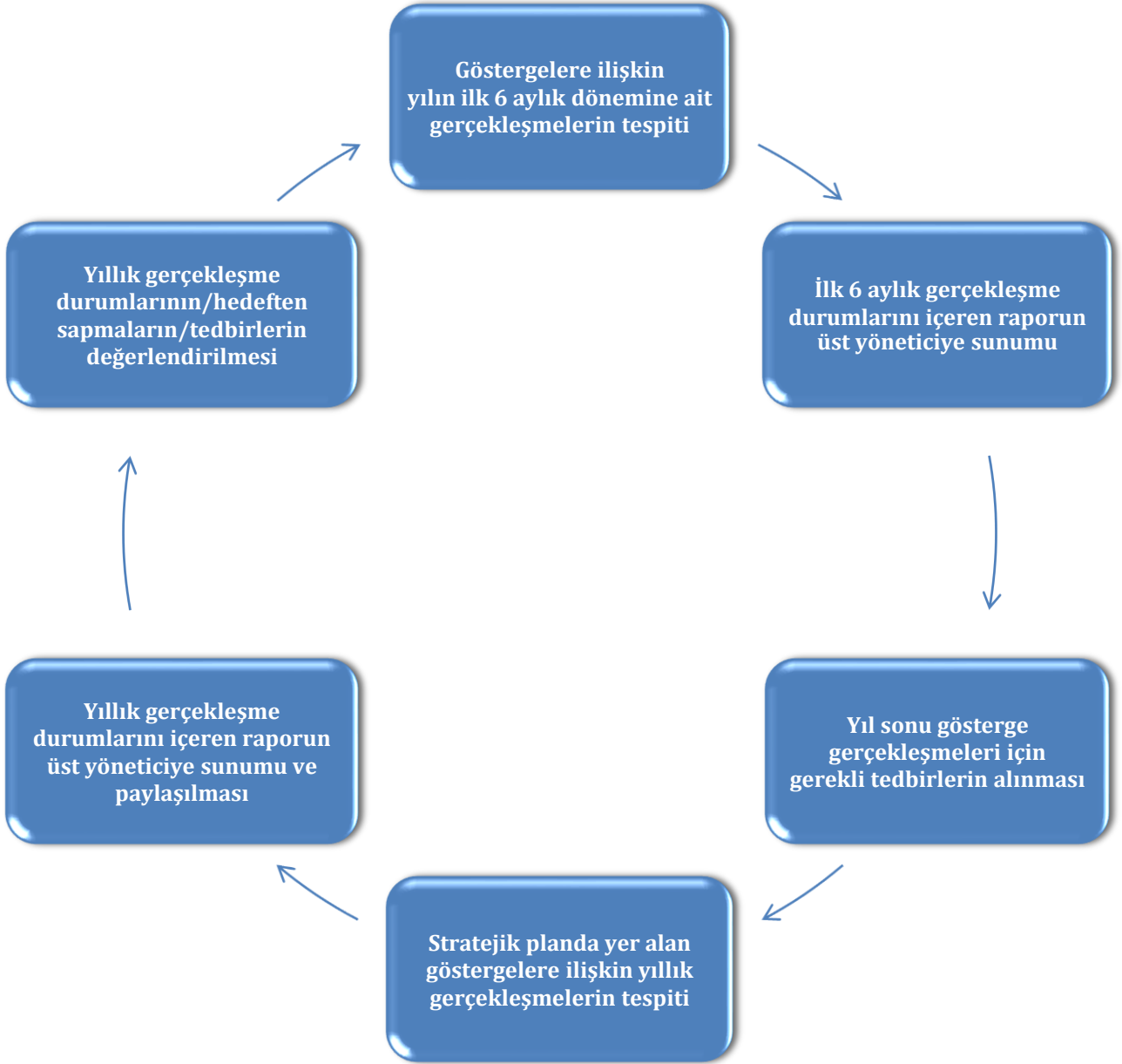
Şekil 5: Ulurmak MTAL 2019-2023 Stratejik Planı İzleme ve Değerlendirme Modeli