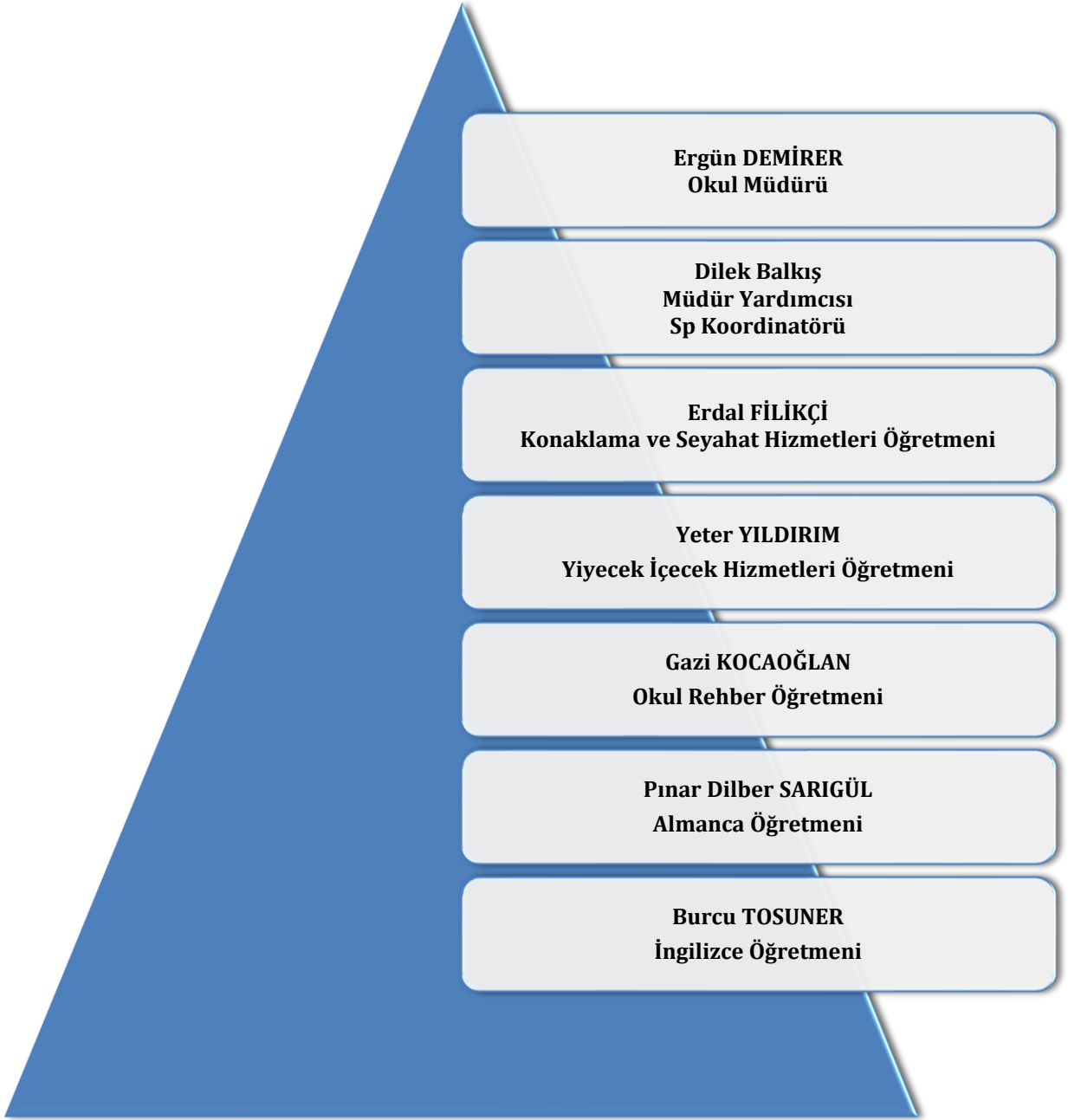
Şekil 1: Ulurmak MTAL Stratejik Koordinasyon Ekibi

Kamu İdarelerinde Stratejik Planlamaya İlişkin Usul ve Esaslar Hakkında Yönetmelik, 2018/16 sayılı genelge ve Stratejik Plan Hazırlama Kılavuzunda belirtilen esaslar doğrultusunda Ulurmak Mesleki ve Teknik Anadolu Lisesi 2019-2023 Stratejik Planı hazırlama çalışmaları başlatılmıştır. Bu çerçevede planlama süreci ve bu süreçte görev alacak kurul ve ekipler ile sürece ilişkin çalışma takvimi belirlenmiştir.