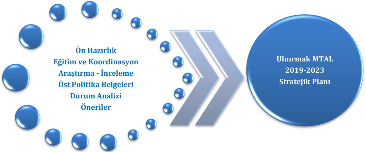
Şekil 2: Ulurmak MTAL Stratejik Plan Oluşum Şeması

Ulurmak Mesleki ve Teknik Anadolu Lisesi 2019-2023 Stratejik Planı Üst Kurulumuzun onayını müteakiben yürürlüğe girmiştir. 2019-2023 Stratejik Planının uygulamaya geçirilmesi ile beraber izleme ve değerlendirme faaliyetleri de başlayacaktır. İzleme ve değerlendirme çalışmalarımız ise altı aylık dönemler halinde senede iki defa gerçekleştirilecektir.