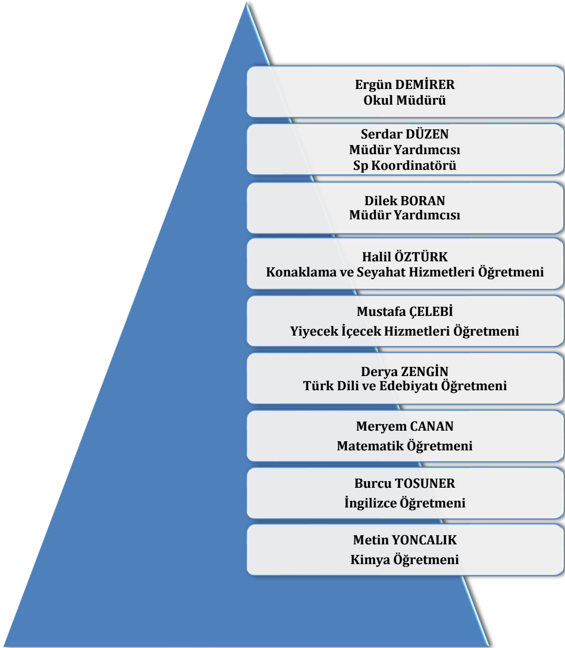
Şekil 1: Ulurmak MTAL Stratejik Koordinasyon Ekibi

Kamu İdarelerinde Stratejik Planlamaya İlişkin Usul ve Esaslar Hakkında Yönetmelik, 2018/16 sayılı genelge ve Stratejik Plan Hazırlama Kılavuzunda belirtilen esaslar doğrultusunda Ulurmak Mesleki ve Teknik Anadolu Lisesi 2024-2028 Stratejik Planı hazırlama çalışmaları başlatılmıştır. Bu çerçevede planlama süreci ve bu süreçte görev alacak kurul ve ekipler ile sürece ilişkin çalışma takvimi belirlenmiştir.