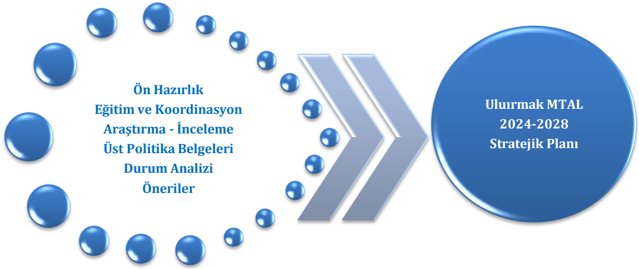
Şekil 2: Ulurmak MTAL Stratejik Plan Oluşum Şeması

Ulurmak Mesleki ve Teknik Anadolu Lisesi 2024-2028 Stratejik Planı Üst Kurulumuzun onayını müteakiben yürürlüğe girmiştir. 2024-2028 Stratejik Planının uygulamaya geçirilmesi ile beraber izleme ve değerlendirme faaliyetleri de başlayacaktır. İzleme ve değerlendirme çalışmalarımız ise altı aylık dönemler halinde senede iki defa gerçekleştirilecektir.