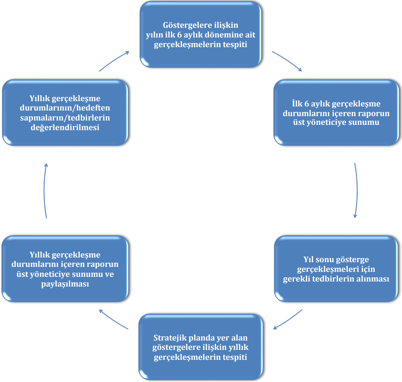
řekil 5: Ulurmak MTAL 2024-2028 Stratejik Planı İzleme ve Deęerlendirme Modeli